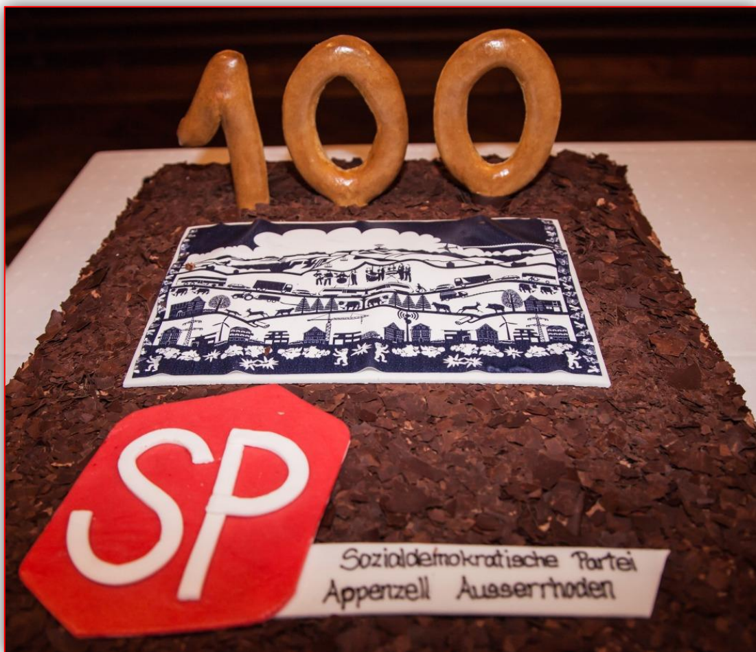
Eine Geburtstagstorte für die Jubilarin.

Zum Parteijubiläum kommt der Präsident der SP Schweiz, Ständerat Christian Levrat, eigens nach Heiden und hält eine „flammende und humorvolle Festrede“ (Appenzeller Zeitung). „Emotionaler Höhepunkt“ ist jedoch der Auftritt von Hans Eugster aus Waldstatt, Enkel des einstmaligen SP-National- und Regierungsrats „Weberpfarrer“ Howard Eugster-Züst. Auch die SBI überbringt ihre Glückwünsche.