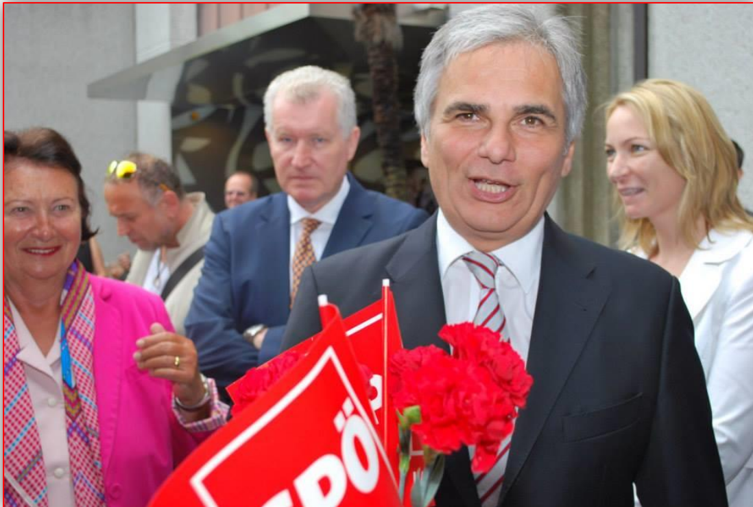
Bundeskanzler und SPÖ-Vorsitzender Werner Faymann beim SPÖ-Empfang in Bregenz.